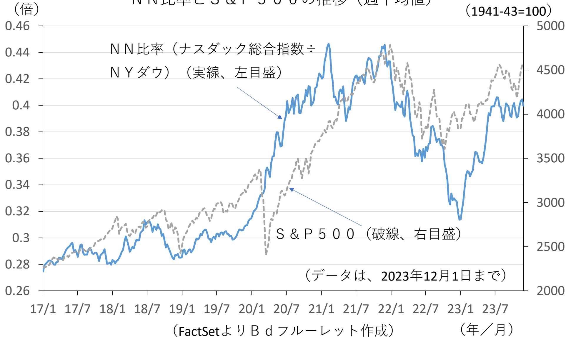
NN比率とS & P 5 0 0の推移（週平均値）