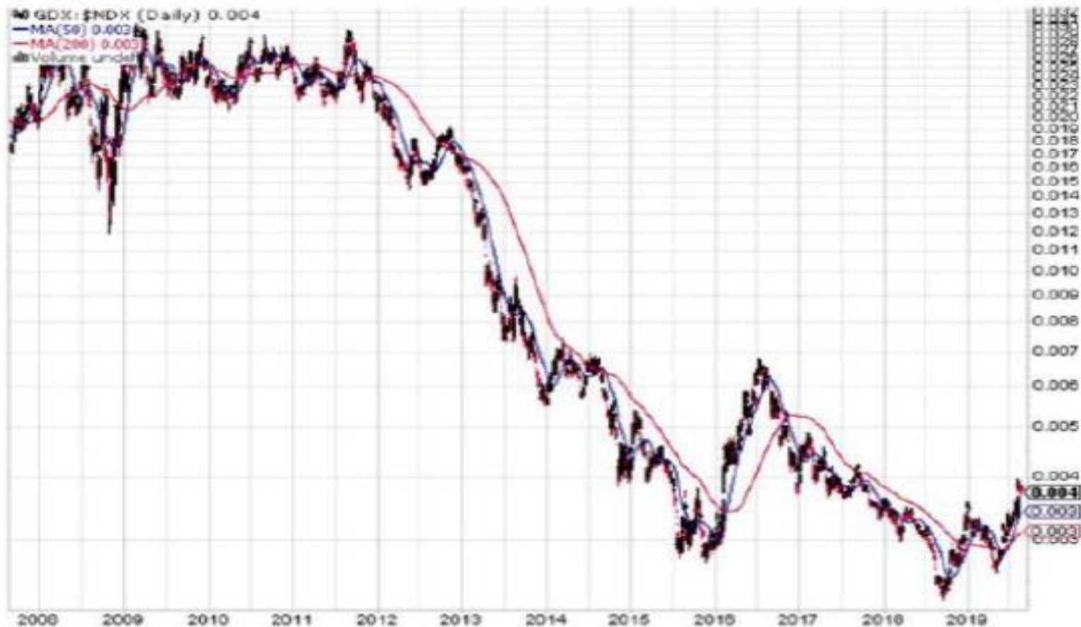
図 20 金鉱株ETF (GDX) とナスダック 100 指数の比較