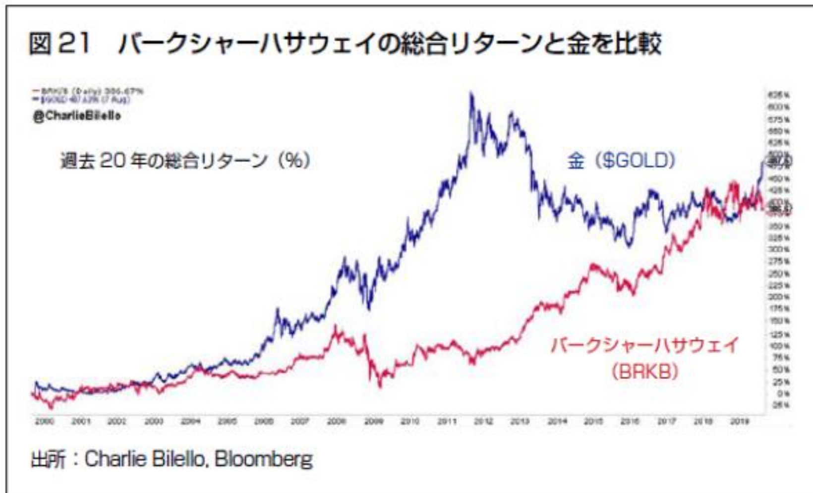
図21 バークシャーハサウェイの総合リターンと金を比較 過去20年の総合リターン (%) 金 ($GOLD) バークシャーハサウェイ (BRKB)