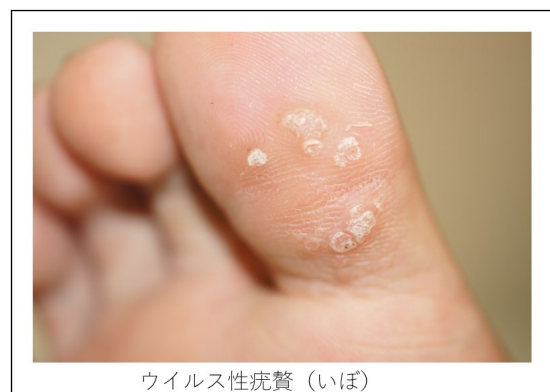
ウイルス性疣贅 (いぼ)

液体窒素療法は痛みを伴いますので、小児の場合は配慮が必要です。1回の治療では治りませんので数回、中には10回以上の再診が必要な場合もあります。通院のたびに過剰な恐怖心を与えてしまってははいけませんので、小児ごとに工夫が必要です。ご褒美のキャラクターシールをプレゼントする、あるいは医療スタッフ一同で励ましの言葉をプレゼントするなど、いかがでしょうか。