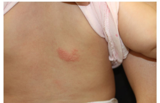
带状疱疹 1歳女子背部の病変